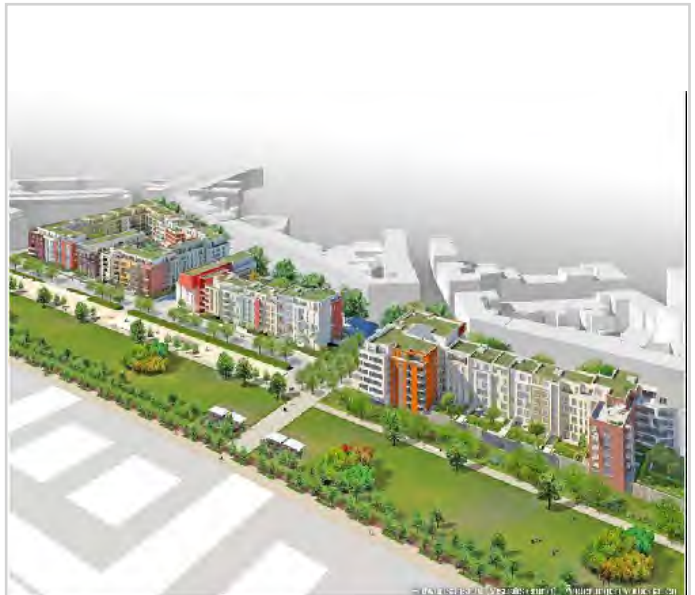
Objekt Umfeld (Visualisierung)