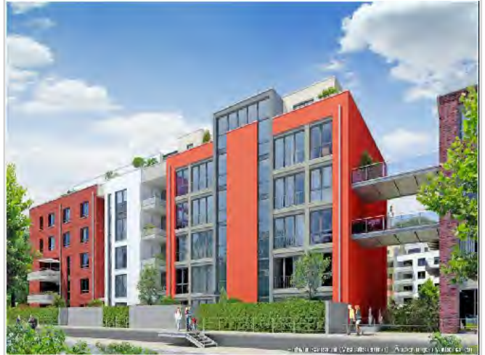
Objekt Umfeld (Visualisierung)