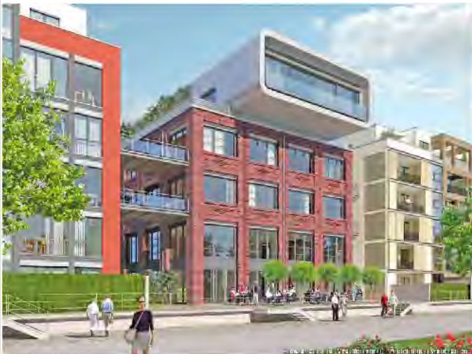
Objekt Umfeld (Visualisierung)