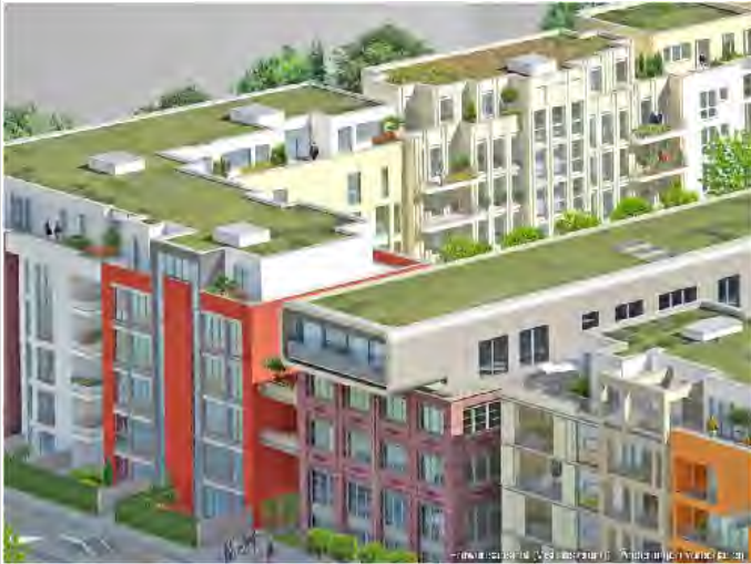
Objekt Umfeld (Visualisierung)

Zimmer: 2,00 Wohnfläche ca.: 63,98 m 2 Kaltmiete: 870,00 EUR (zzgl. Nebenkosten)