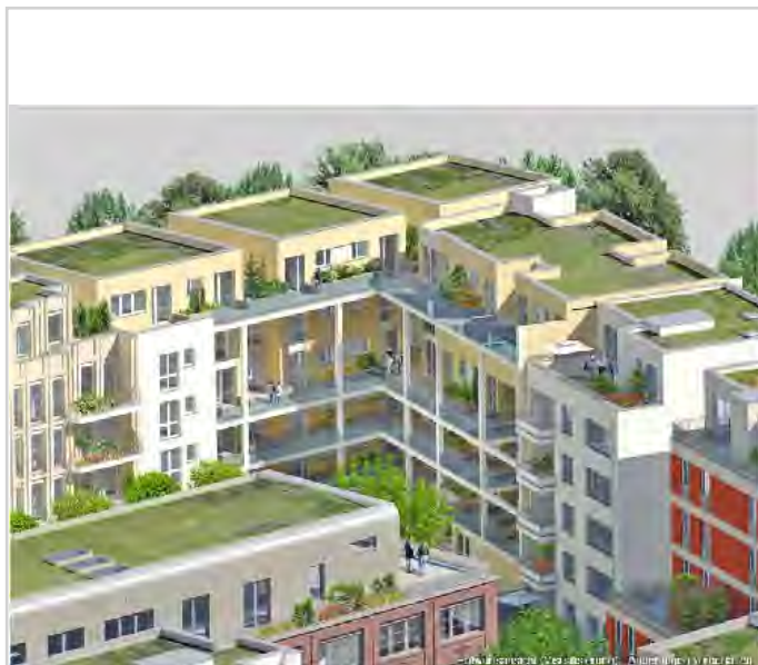
Objekt Umfeld (Visualisierung)