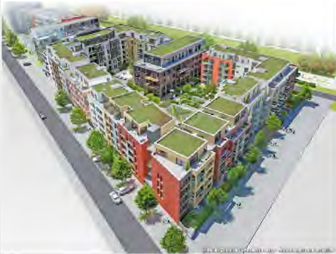
Objekt Umfeld (Visualisierung)

Zimmer: 2,00 Wohnfläche ca.: 63,98 m 2 Kaltmiete: 870,00 EUR (zzgl. Nebenkosten)